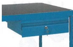
33000691 Anbausatz für Tischwagen